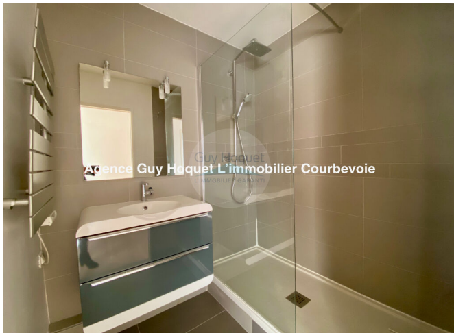
Guy Hoquet Agence Guy Hoquet L'immobilier Courbevoie