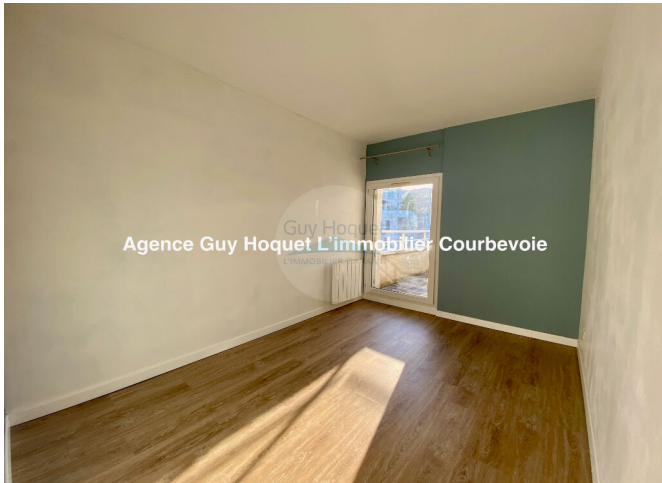
Guy Hoquet Agence Guy Hoquet L'immobilier Courbevoie