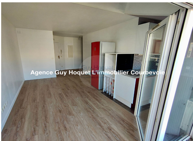
Agence Guy Hoquet L'immobilier Courbevoie