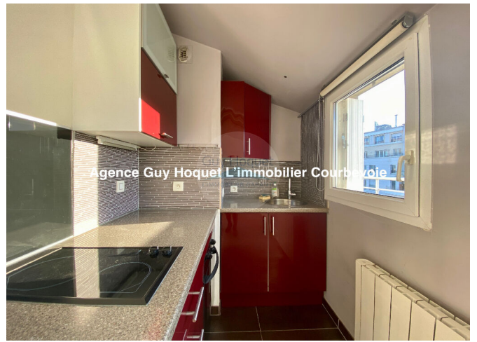
Agence Guy Hoquet L'immobilier Courbevoie