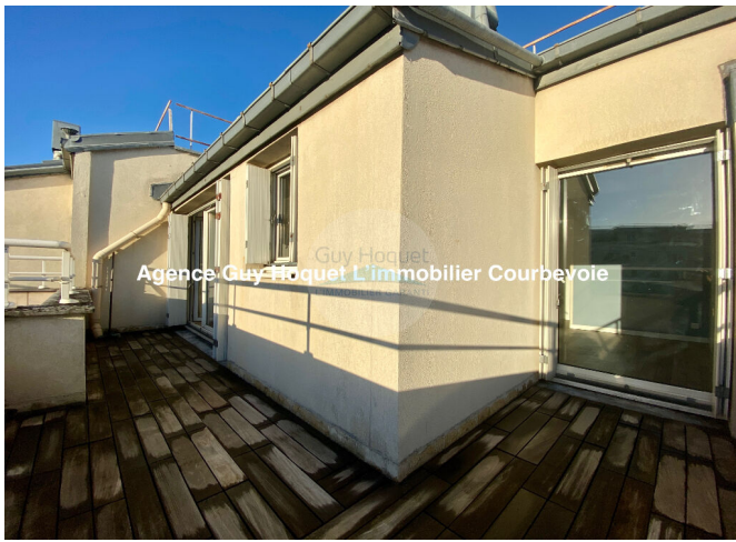
Guy Hoquet Agence Guy Hoquet L'immobilier Courbevoie