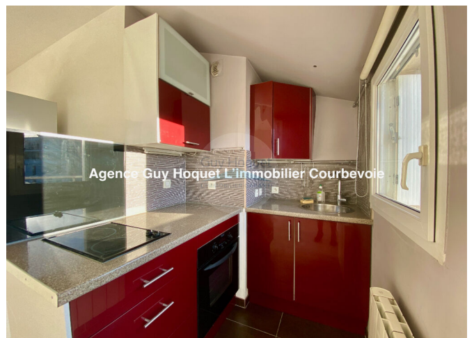
Agence Guy Hoquet L'immobilier Courbevoie